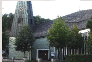
Lütmarsen – St. Marien Kirchstraße 37671 Höxter-Lütmarsen