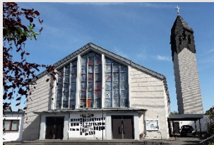
Bödexen – St. Anna Mühlenberg 5 37671 Höxter-Bödexen