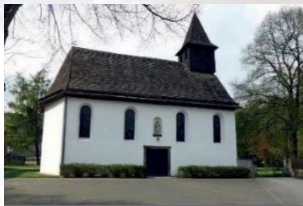
Bruchhausen – St. Marien Brokhusenstr. 18 37671 Höxter-Bruchhausen