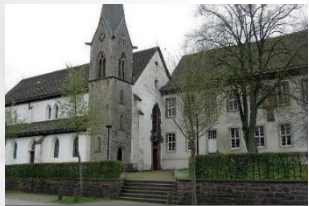
Brenkhausen – St. Johannes Propsteistr. 1 37671 Höxter-Brenkhausen