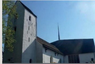
Godelheim – St. Johannes Zur Helle 37671 Höxter-Godelheim