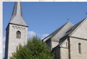
Ottbergen – Heilig Kreuz Kirchwinkel 1 37671 Höxter-Ottbergen