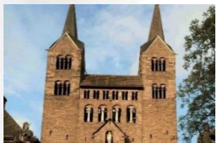
Corvey – St. Stephanus & St. Vitus, Corvey 37671 Höxter