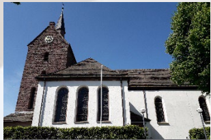
Albaxen – St. Dionysius Dionysiusstr. 6 37671 Höxter-Albaxen