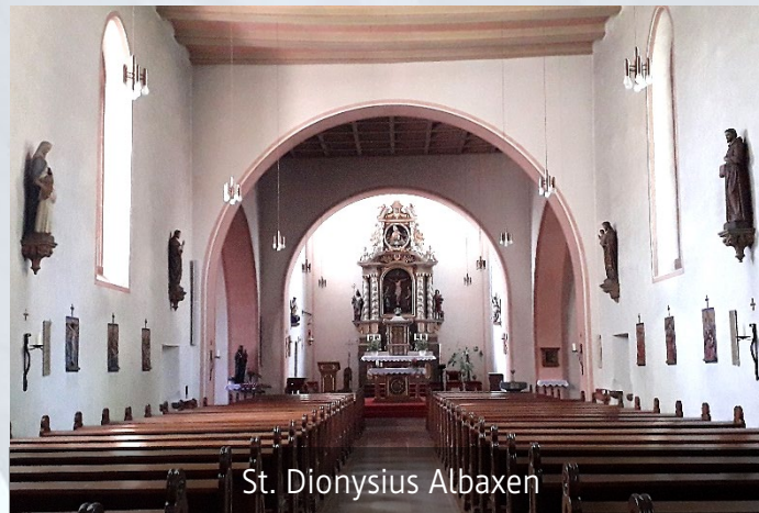
St. Dionysius Albaxen

Kirchen sind Orte des Glaubens und der Gemeinschaft. Richtig lebendig werden sie durch Gottesdienste, Gemeinden und geeignete Musik. Unser Förderverein möchte hier helfen und Brücken bauen, so dass Kirchenmusik in allen Facetten lebendiger Baustein der heiligen Orte dieser Region bleiben kann. Helfen Sie mit durch Ihre Spende, durch Ihre Mitgliedschaft. Warum nicht?!