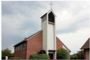
Boffzen – St. Liborius Eichendorffstr. 1 37691 Boffzen