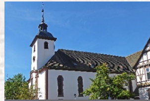
Höxter – St. Nikolai Marktplatz 37671 Höxter