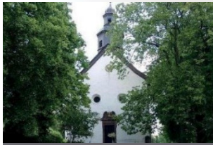
Bosseborn – St. Marien Herrenburgstraße 37671 Höxter-Bosseborn