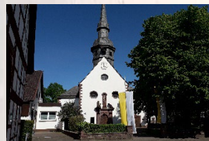
Stahle – St. Anna Johann-Prior-Str. 1 37671 Höxter-Stahle