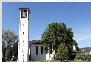
Höxter – St. Peter & Paul Stephanusstr. 11 37671 Höxter