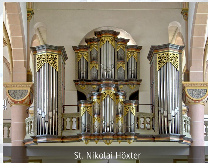
St. Nikolai Höxter

Förderverein Kirchenmusik im Pastoralen Raum Corvey e.V. Marktstr. 19 37671 Höxter