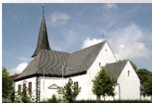
Fürstenau – St. Anna Hohehäuser/Detmolder Str. 37671 Höxter-Fürstenau